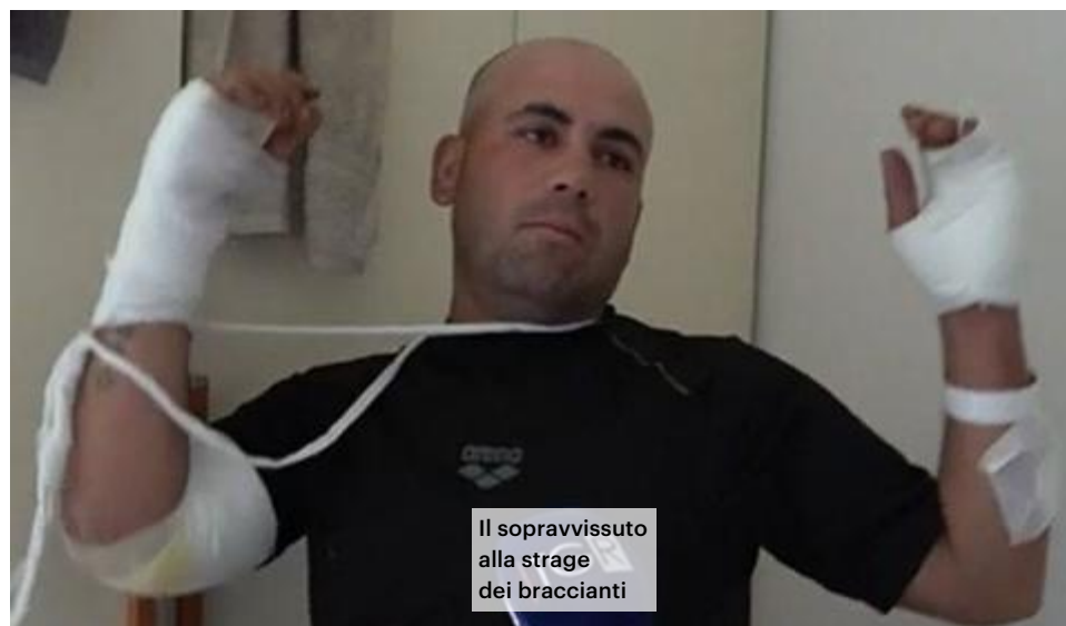
Il sopravvissuto alla strage dei braccianti