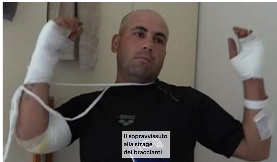
Il sopravvissuto alla strage dei braccianti