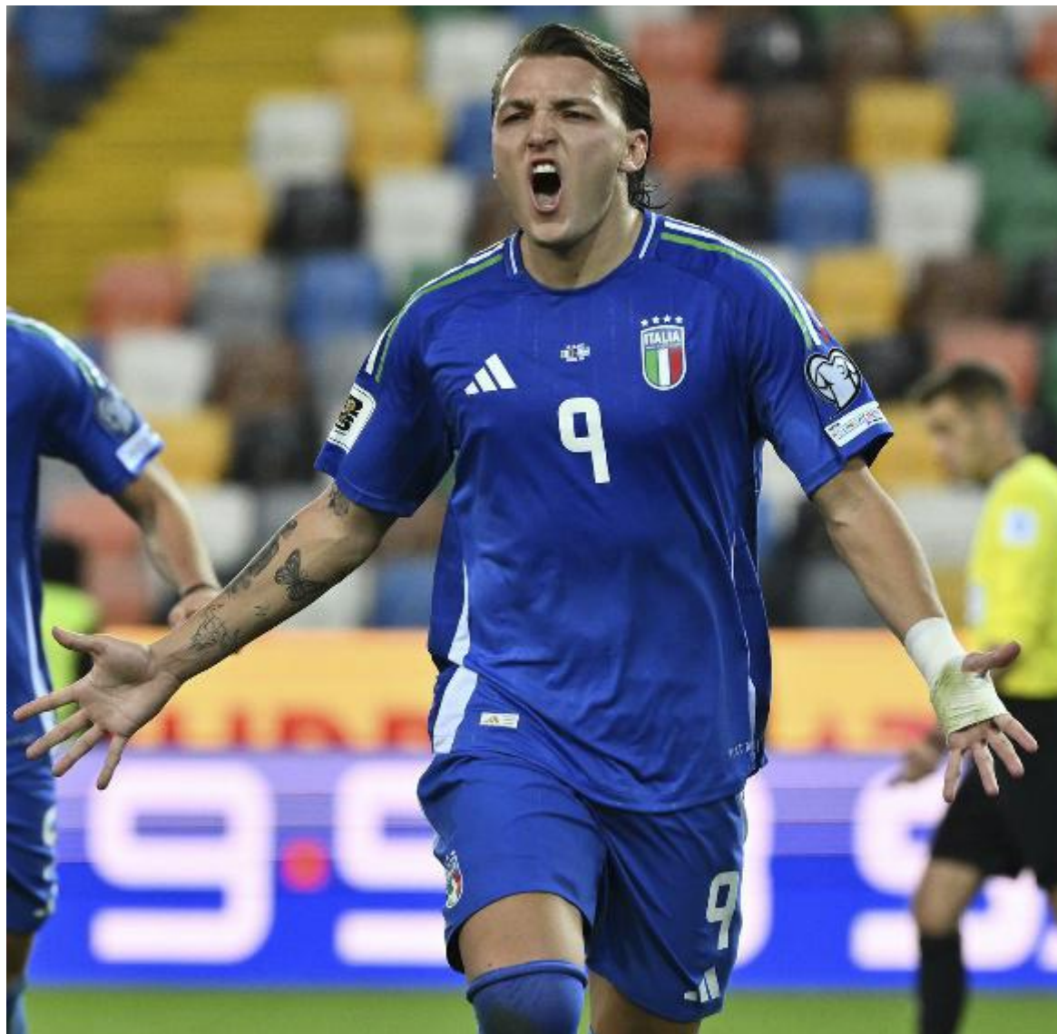
20,45 A BERGAMO, ITALIA AL MATCH VERITÀ CON L'IRLANDA DEL NORD

Ci conosciamo troppo bene per non sapere quanto siamo bravi a nasconderci i problemi: nel paese in cui nessuno ammette e si dimette neanche di fronte ai fallimenti, figuriamoci come potrebbe andare se dovessimo sfangarla. Ma il punto è proprio questo: se i nostri club escono sempre prima dalle coppe europee che contano, se un'intera generazione non ricorda un'Italia ai mondiali, se in troppe cose siamo diventati ormai gli spettatori del parco giochi degli altri, è perché non siamo più capaci di fare sistema, di vedere oltre il nostro naso o il nostro Var. In quasi tutti gli altri sport, l'Italia ci riesce. Se rivogliamo un calcio da protagonisti, dovremo farcela anche lì. Comunque vada stasera.