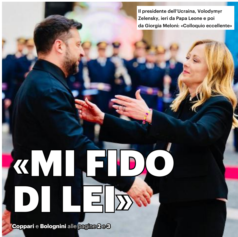
Il presidente dell'Ucraina, Volodymyr Zelensky, ieri da Papa Leone e poi da Giorgia Meloni: «Colloquio eccellente»