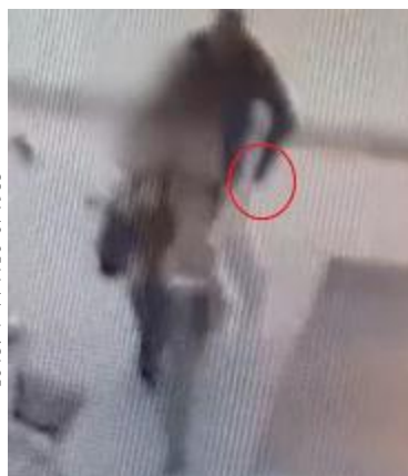
Il frame del video con l'accoltellamento

I due non hanno legami Nel 2015 lui ferì anziani a caso