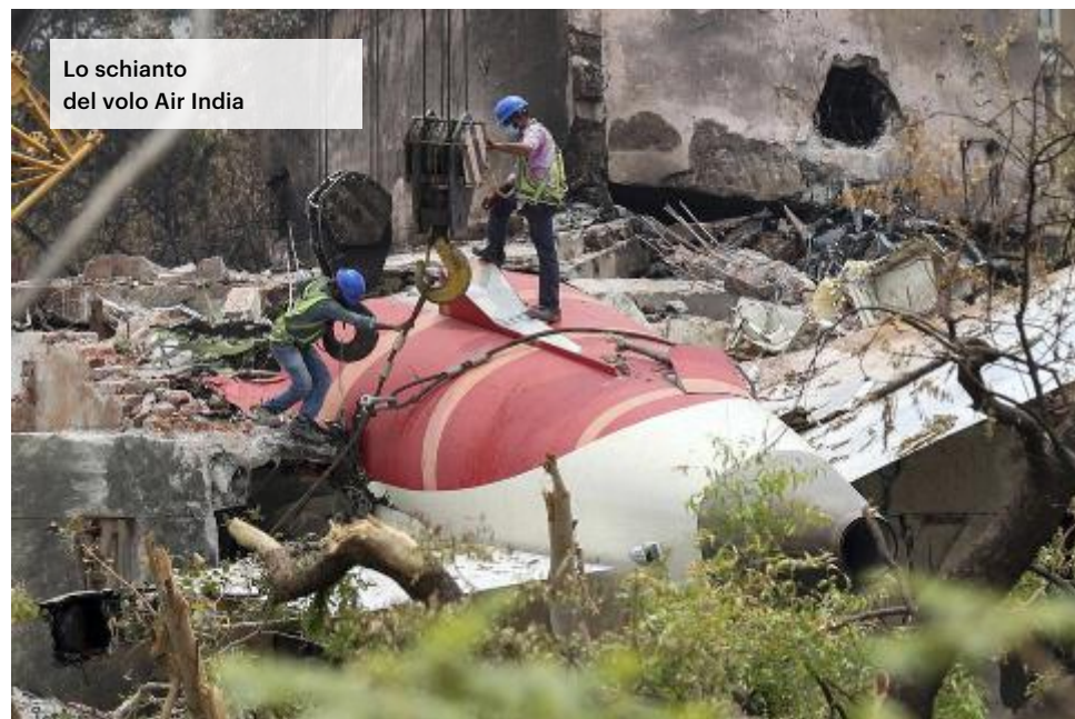
Lo schianto del volo Air India