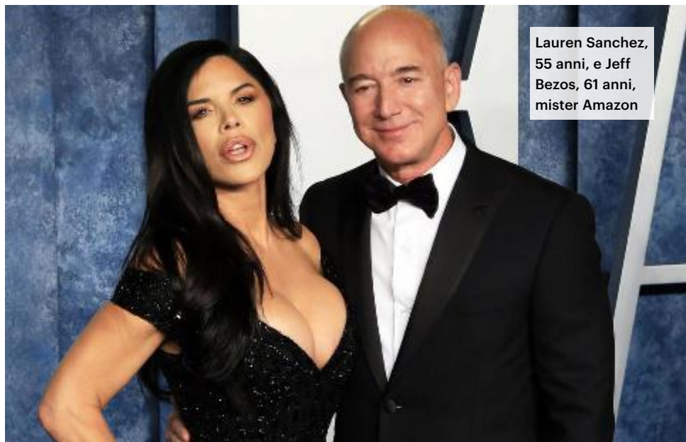
Lauren Sanchez, 55 anni, e Jeff Bezos, 61 anni, mister Amazon