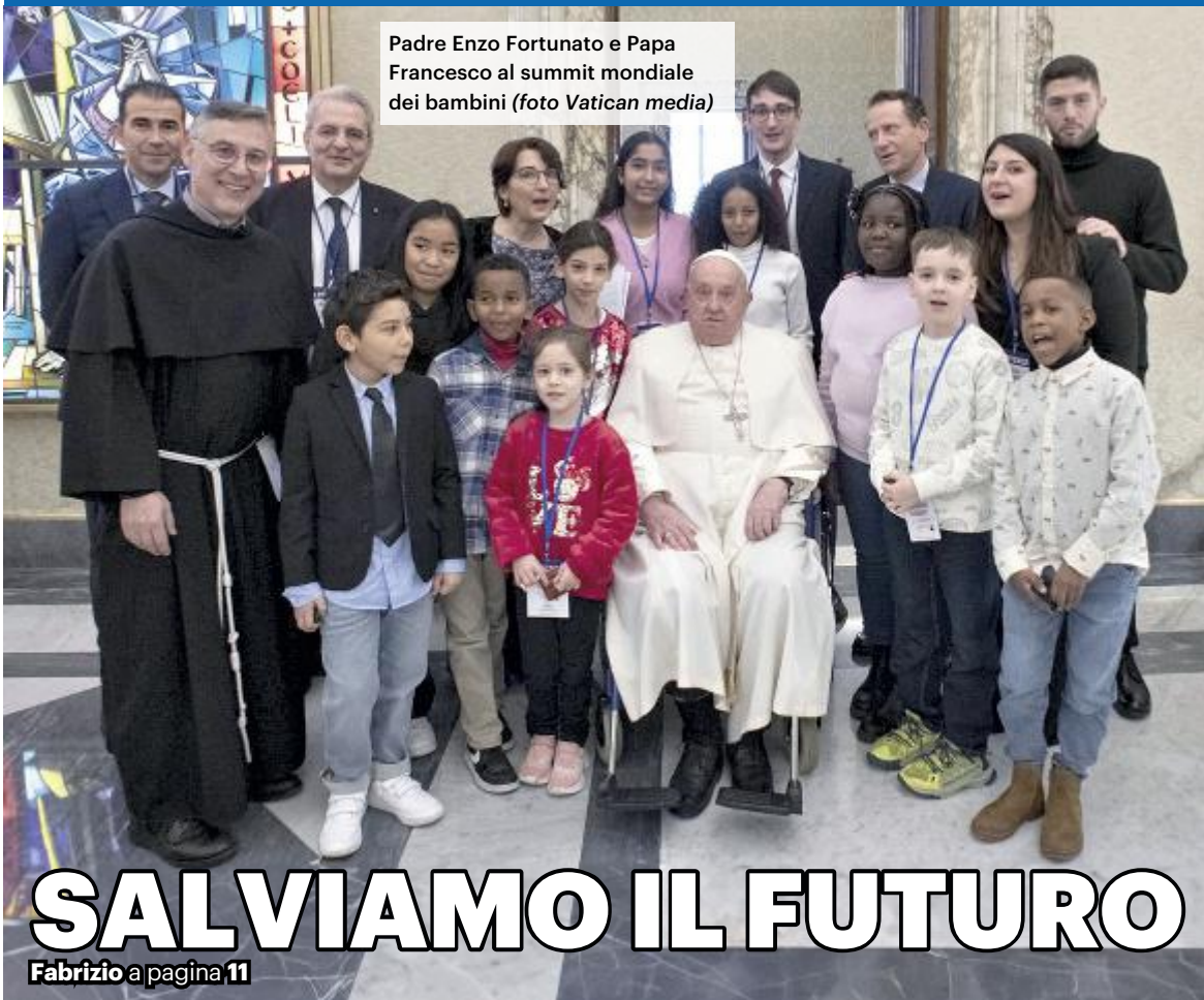
Padre Enzo Fortunato e Papa Francesco al summit mondiale dei bambini

IL PAPA AL SUMMIT PER I BAMBINI RIFUGIATI O VITTIME DI GUERRE «È IL GRIDO DELL'INFANZIA NEGATA». PADRE FORTUNATO: PIÙ CORAGGIO