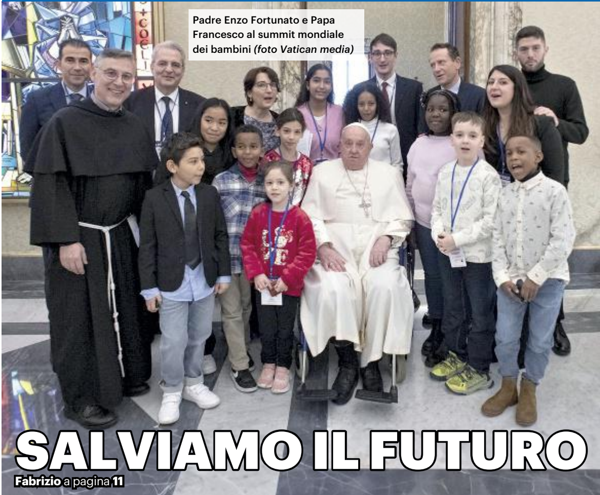
Padre Enzo Fortunato e Papa Francesco al summit mondiale dei bambini

IL PAPA AL SUMMIT PER I BAMBINI RIFUGIATI O VITTIME DI GUERRE «È IL GRIDO DELL'INFANZIA NEGATA». PADRE FORTUNATO: PIÙ CORAGGIO