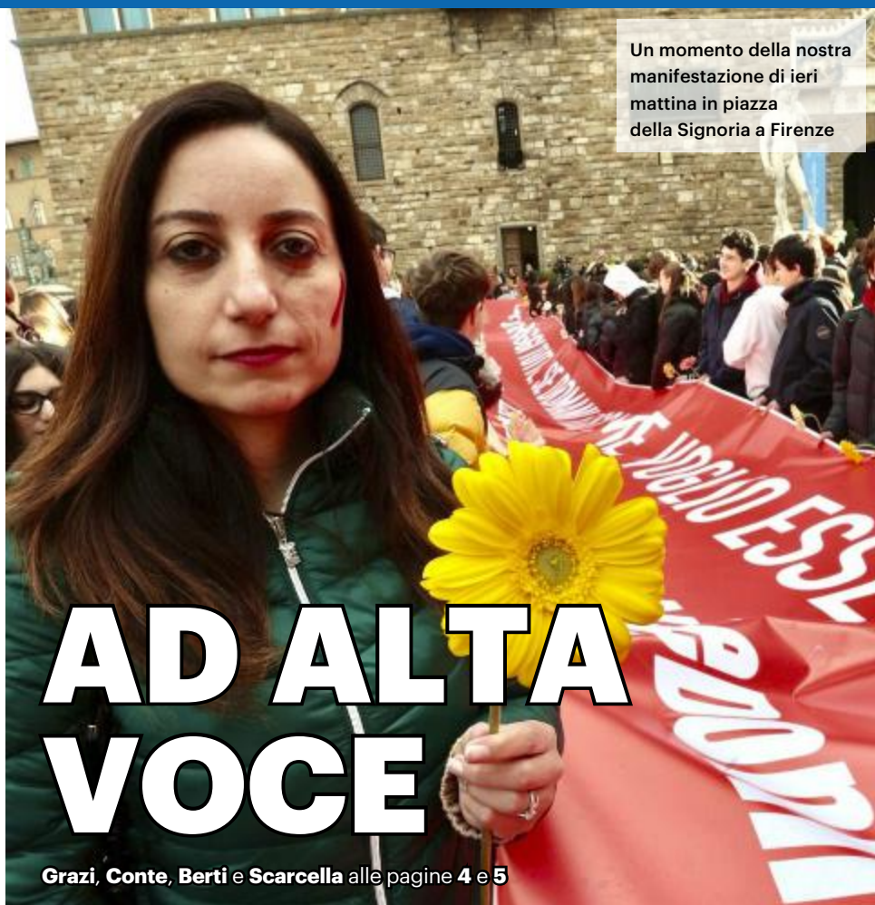
Un momento della nostra manifestazione di ieri mattina in piazza della Signoria a Firenze

Chiesto il carcere a vita anche per Filippo Turetta