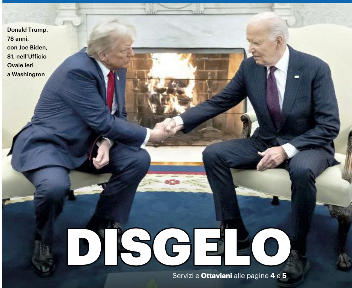
Donald Trump, 78 anni, con Joe Biden, 81, nell'Ufficio Ovale ieri a Washington

TRUMP DA BIDEN ALLA CASA BIANCA PARLA DI «TRANSIZIONE FLUIDA» UN FAIR PLAY INATTESO. IL TYCOON AVVIA LE NOMINE SOVRANISTE