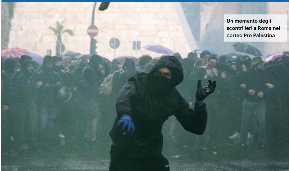
Un momento degli scontri ieri a Roma nel corteo Pro Palestina