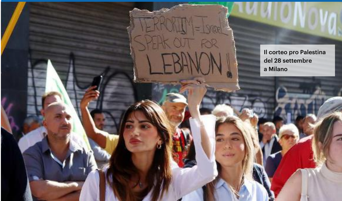
Il corteo pro Palestina del 28 settembre a Milano