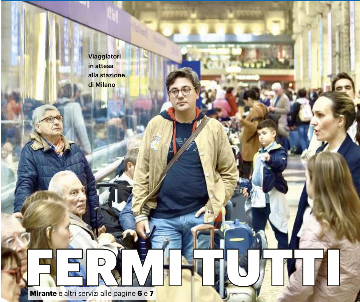
Viaggiatori in attesa alla stazione di Milano

GUASTO ALLA RETE FERROVIARIA, 100 TRENI CANCELLATI O IN RITARDO SALVINI: «COLPA DI UN CHIODO». LE SCUSE DI RFI, MA È POLEMICA