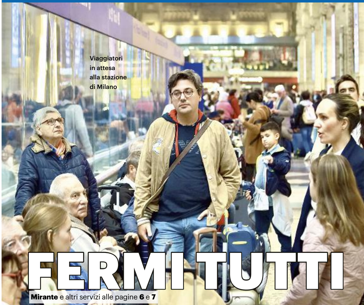
Viaggiatori in attesa alla stazione di Milano

GUASTO ALLA RETE FERROVIARIA, 100 TRENI CANCELLATI O IN RITARDO SALVINI: «COLPA DI UN CHIODO». LE SCUSE DI RFI, MA È POLEMICA