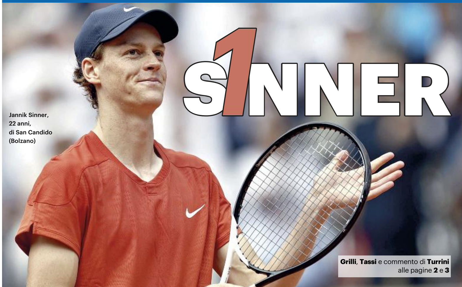
Jannik Sinner, 22 anni, di San Candido (Bolzano)

DJOKOVIC SI RITIRA DAL ROLAND GARROS E L'ALTOATESINO DIVENTA IL NUMERO UNO AL MONDO È LA PRIMA VOLTA IN ASSOLUTO PER UN TENNISTA ITALIANO: «CONTINUERÒ A FARE SACRIFICI»