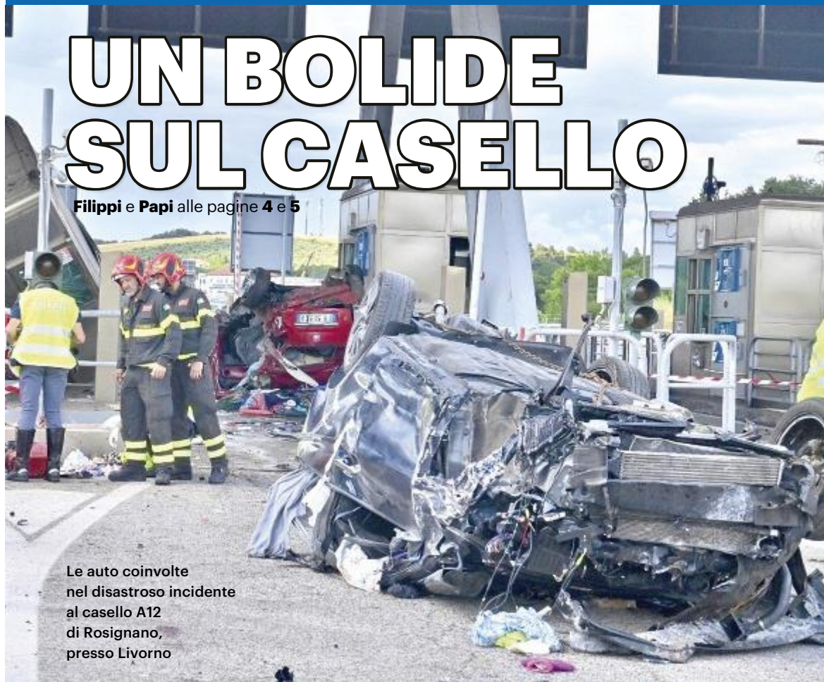
Le auto coinvolte nel disastroso incidente al casello A12 di Rosignano, presso Livorno