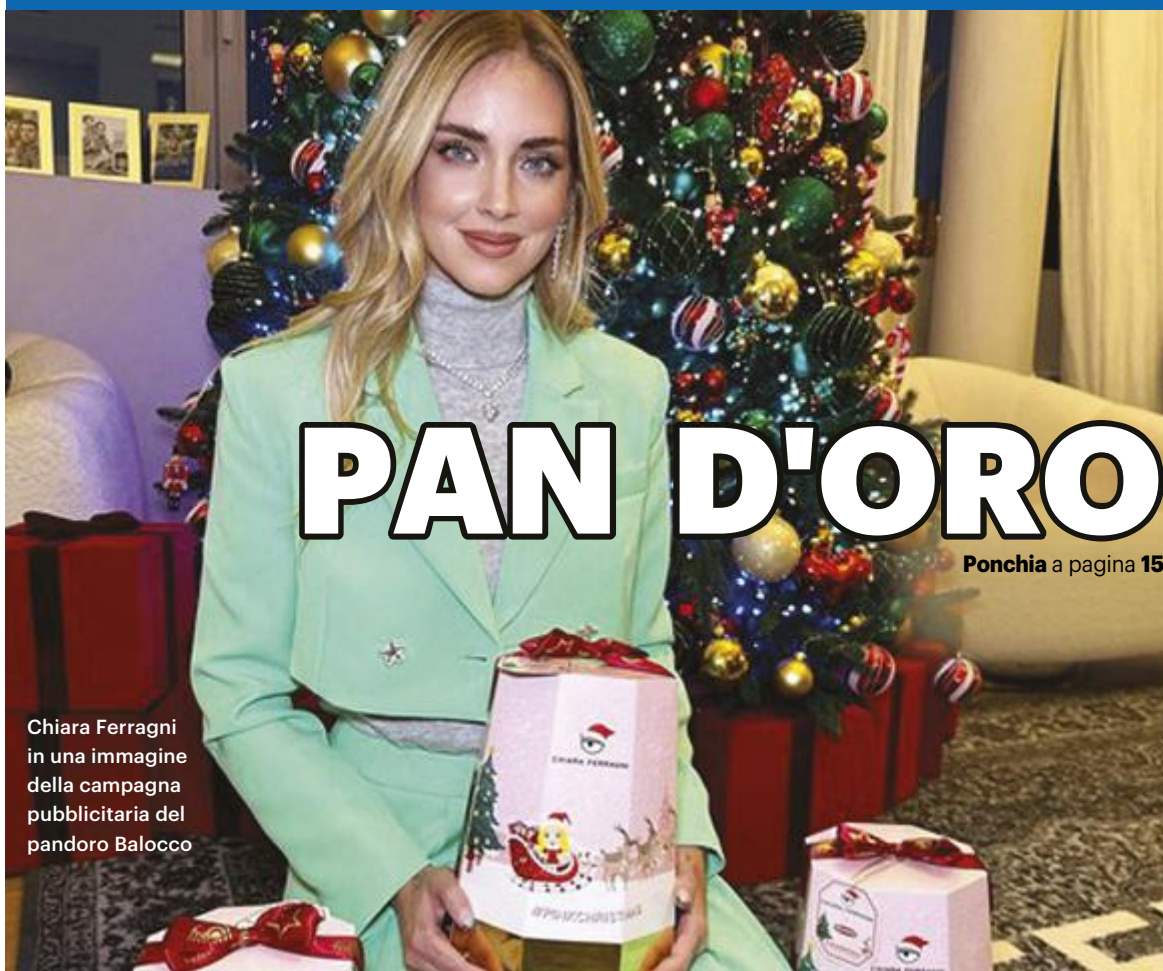
Chiara Ferragni in una immagine della campagna pubblicitaria del pandoro Balocco

STANGATA DELL'ANTITRUST: MULTA DI UN MILIONE A FERRAGNI «LO SPOT BENEFICO ERA INGANNEVOLE». LEI: «DECISIONE INGIUSTA»